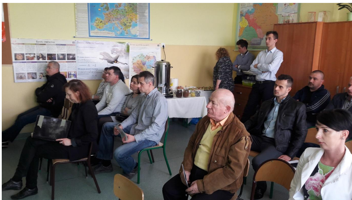
Zdjęcia ze spotkania w Woli Kalinowskiej: